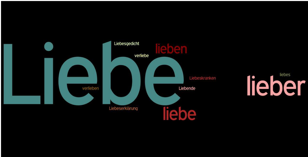
Figur 3: „Liebe.“ Bildtext von E.S. Özdamars Liebensprache in Mutterzunge (1990). Erstellt mit Hilfe von Wordle .