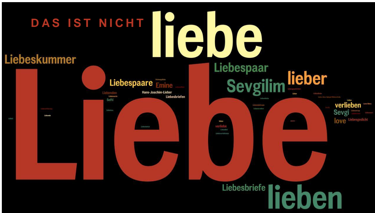
Figur 1: „Das ist nicht Liebe.“ Bildtext von E.S. Özdamars Liebessprache aus all ihren Werken. Erstellt mit Hilfe von Wordle .

Lange schon werden wissenschaftliche Diskurse geführt. Die Genealogie der wissenschaftlichen Arbeit lehrt uns, die höchste Leistung sei erreicht, wenn – bestenfalls ohne Zweideutigkeiten – Ereignisse, Ideen oder Bezüge dargestellt werden.