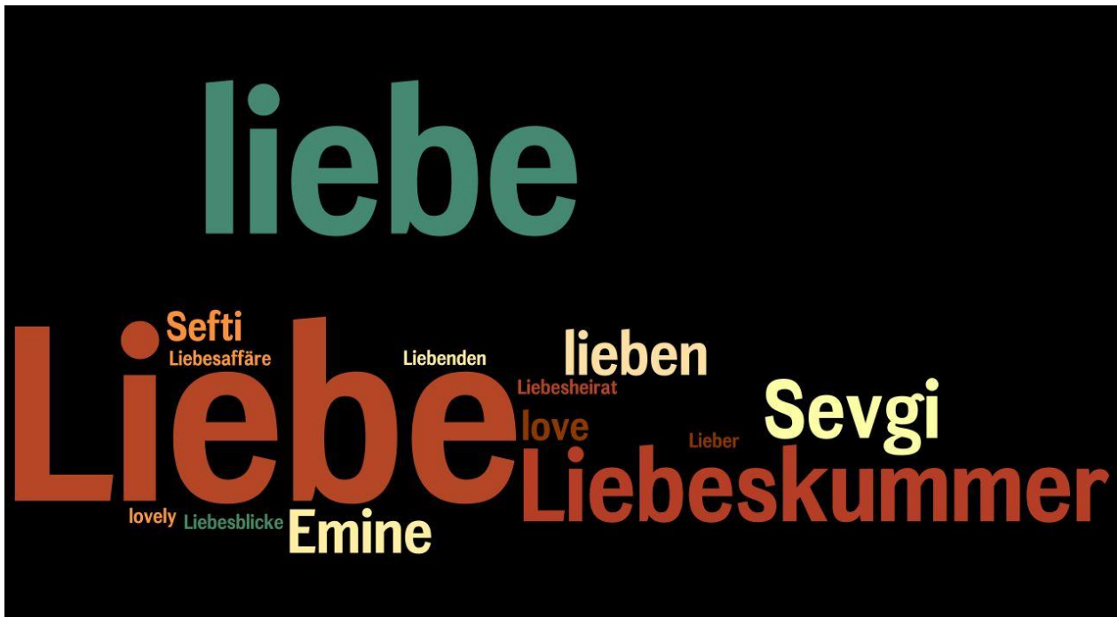
Figur 6: „Emine Sevgi Liebeskummer.“ Bildtext von E.S. Özdamars Liebensprache in Der Hof im Spiegel (2001). Erstellt mit Hilfe von Wordle .