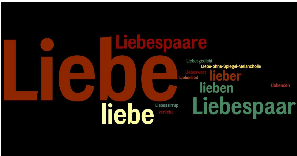
Figur 4: „Liebespaare.“ Bildtext von E.S. Özdamars Liebensprache in Das Leben ist eine Karawanserei aus einer kam ich rein aus der anderen ging ich raus (1992). Erstellt mit Hilfe von Wordle .