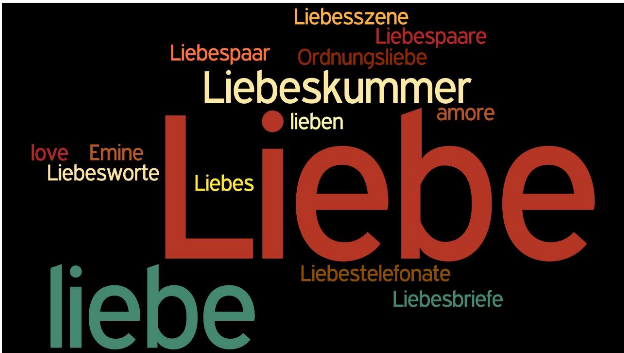
Figur 7: „Liebesliebe.“ Bildtext von E.S. Özdamars Liebesprache in Seltsame Sterne starren zur Erde. Wedding-Pankow 1976/77 (2003). Erstellt mit Hilfe von Wordle .